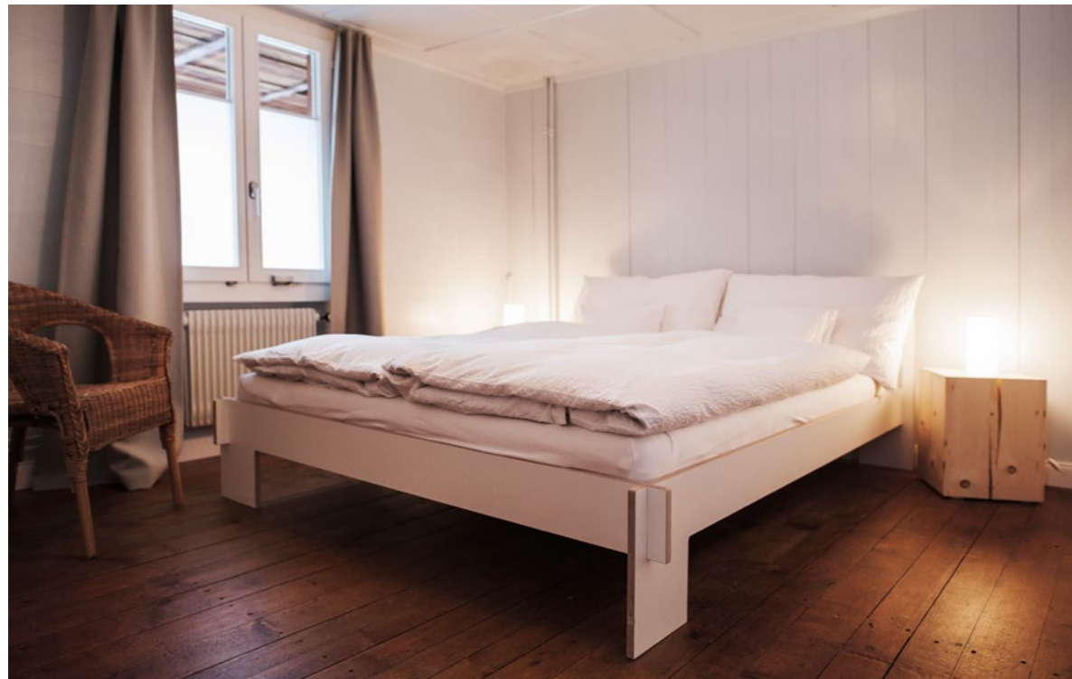
Mit Charme gebettet: Übernachten im «Siebenschläfer» von Moormann.